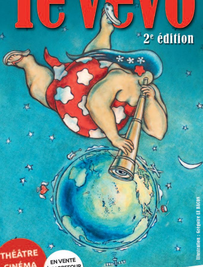
Illustration : Grégoire LE BACON